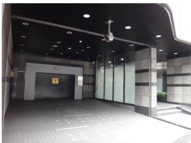
正面道路に面した機械式駐車場