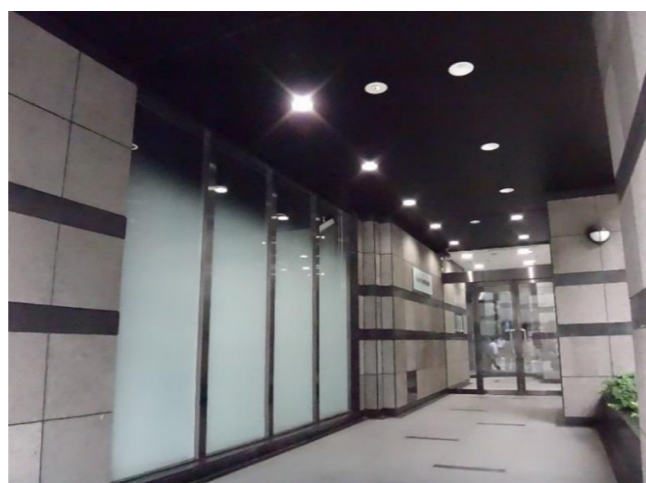
正面エントランス