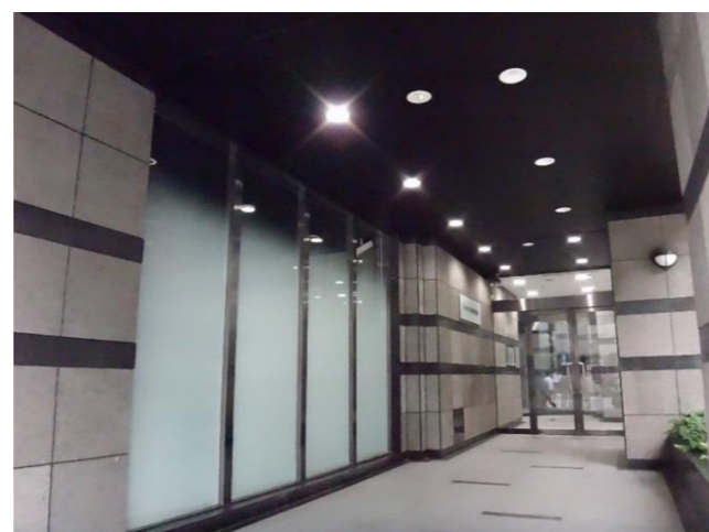
正面エントランス